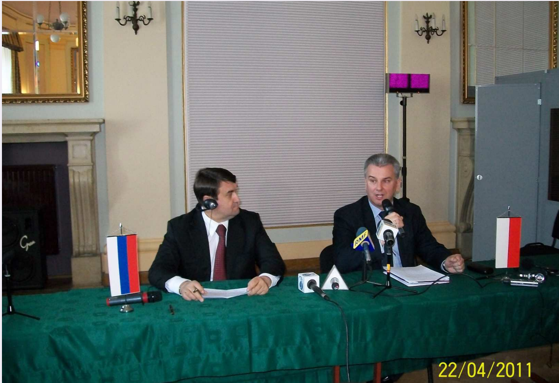
Na zdjęciu od lewej: rosyjski Minister Transportu I. Lewitin i polski Minister Infrastruktury C. Grabarczyk

opr. Marek Ociepka Kierownik WPHI Moskwa